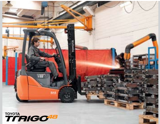
TOYOTA TRAIGO 48

De Traigo bestaat in een 48- en 24-voltversie. De 48-serie heeft een laadcapaciteit van 1,5 tot 2 ton en heeft een 3- en 4-wieluitvoering. De 24-serie behandelt ladingen van 1 tot 2 ton en is uitgerust met 3 wielen.