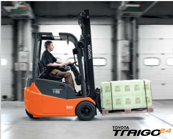
TOYOTA TRAIGO 24